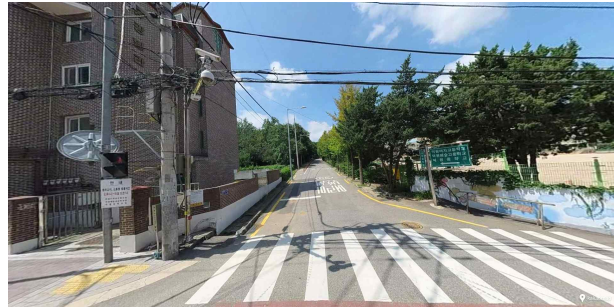
① 덕원여고 진입로 초입부