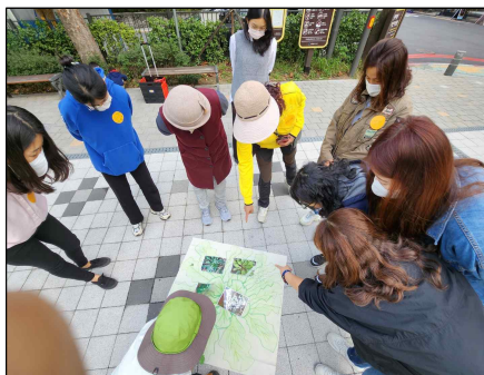
1. 생태교실 1기 활동사진