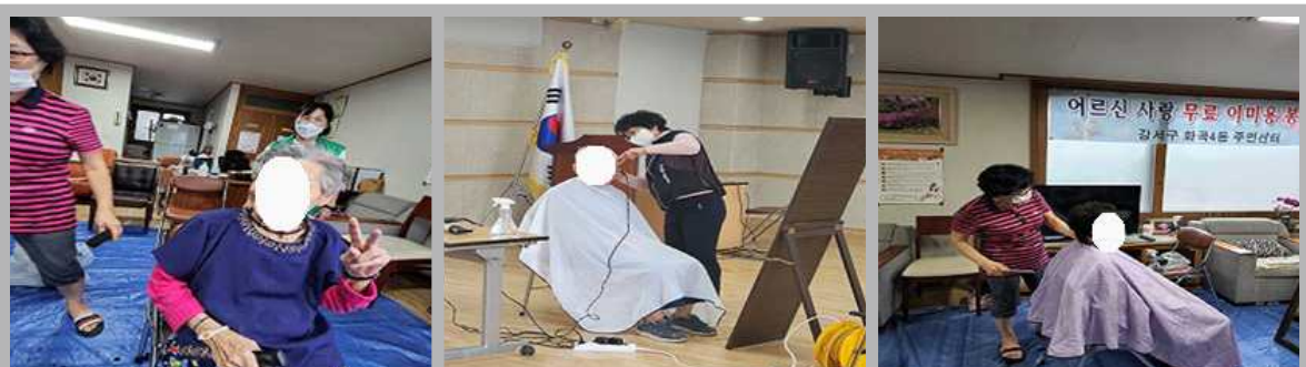
관리받는 노년을 위한 청춘아! 게 섰거라