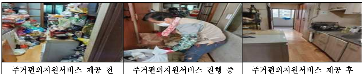
주거편의지원서비스 제공 전