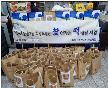
「찾아가는 떡 배달」