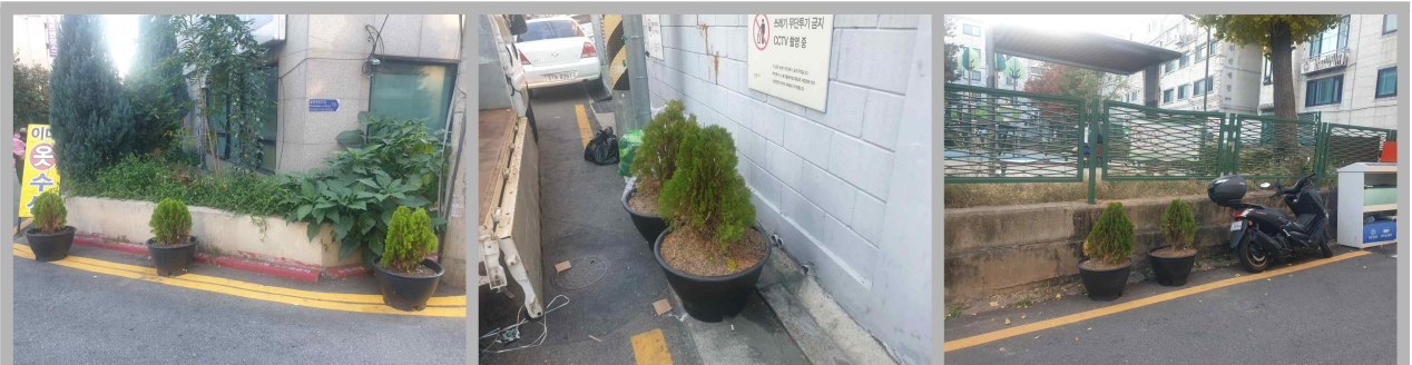
“양심을 버리지 않아요” 「화4한 동네 만들기」