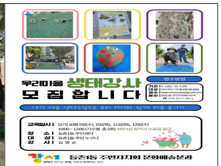
3. 생태교실 참여자 모집 홍보문