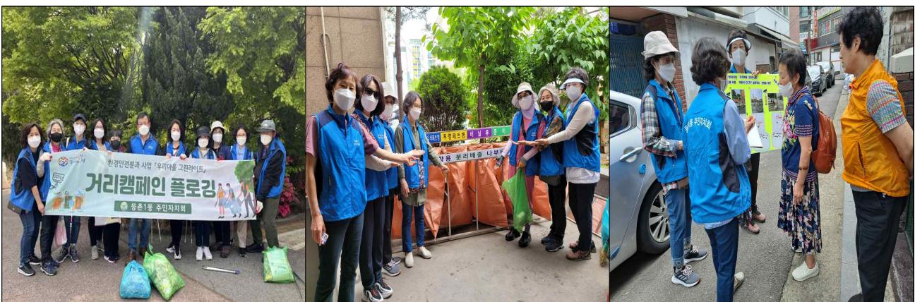
1. 거리캠페인 플로깅 진행