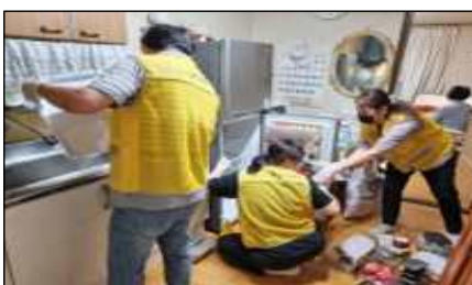
홀몸어르신 냉장고 정리