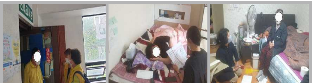
어려운 이웃을 찾는 파수꾼