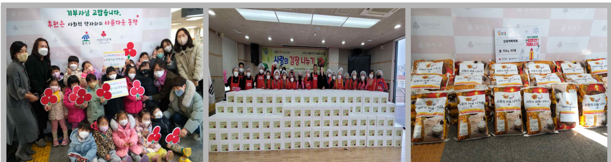
이웃돕기 기금 마련 「천만다행 모금 릴레이」