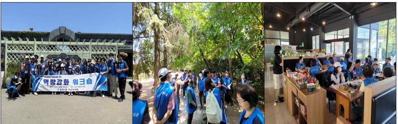
1. 파주 벽초지 수목원 방문