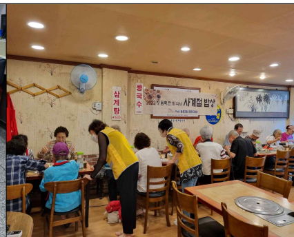
정 듬뿍 한 끼 식사 「사계절 밥상」