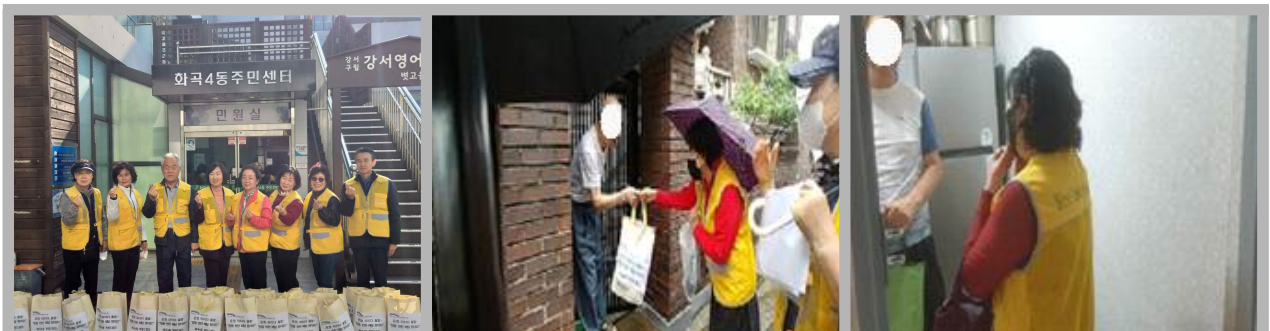
온정 라이더 출발~ ‘땡동 반찬 배달 왔어요’