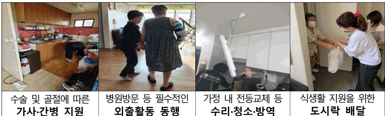
수술 및 골절에 따른 가사·간병 지원