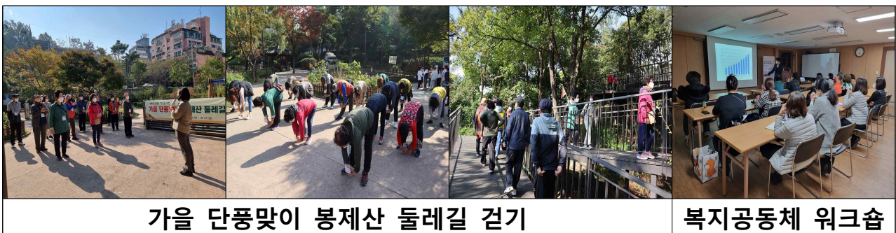
가을 단풍맞이 봉제산 둘레길 걷기