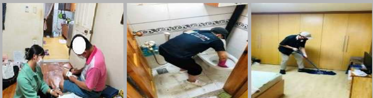
돌봄공백 해소를 위한 돌봄SOS센터 서비스 지원