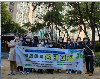
2. 생태교실 2기 참여자 수료식