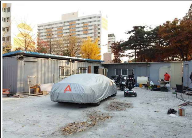
가설건축물 2동 설치(24m 2 , 36m 2 )