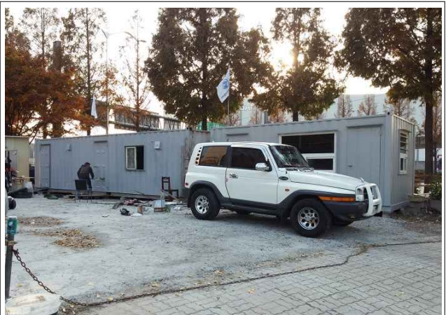
가설건축물 2동 설치(36m 2 , 18m 2 )