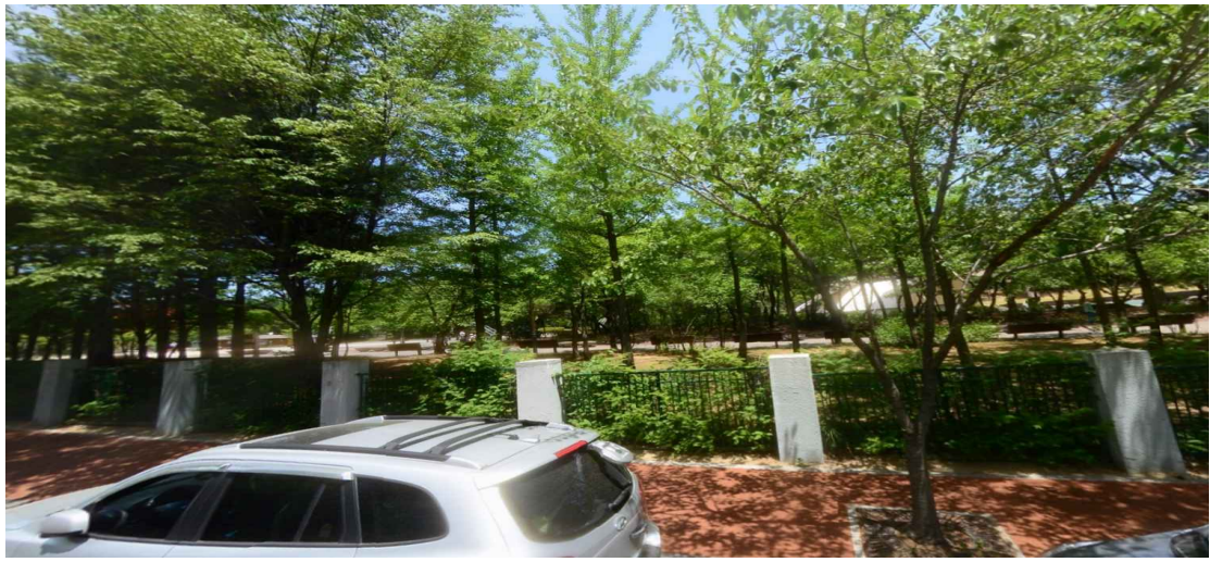
방화근린공원 담장 현황