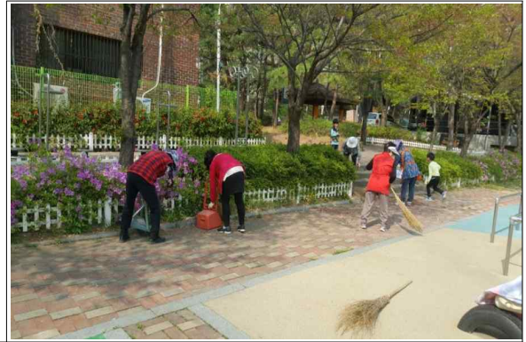
“외발산동 신광명마을” 환경가꾸기