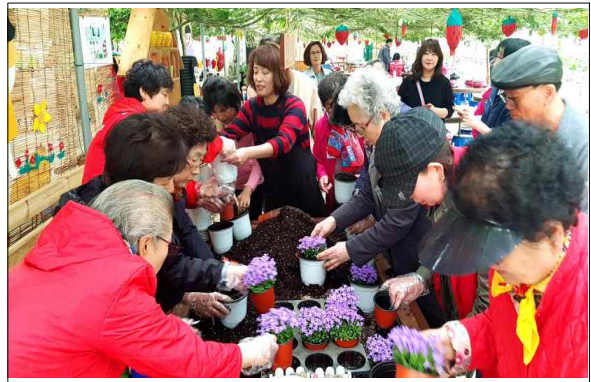
혼자가 아닌 세상 힐링 나눔