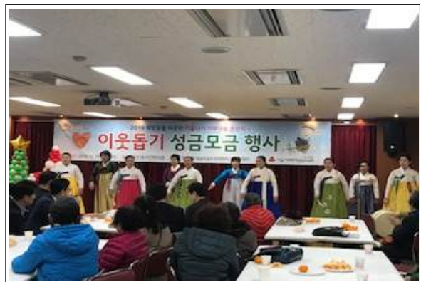
이웃돕기 성금 모금 행사