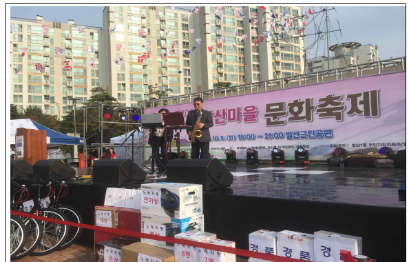
제10회 발산마을 문화축제