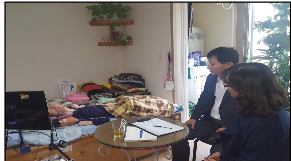
동장, 복지플래너 동행 방문