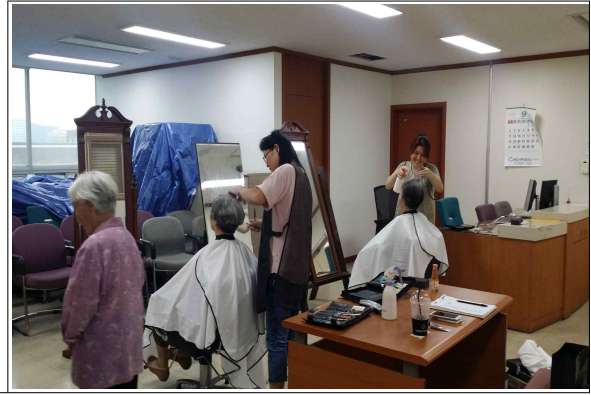
어르신 이·미용 서비스